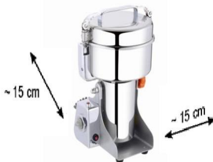
Рис.4 – Регламентированная установка оборудования (размещение на рабочей поверхности) до сторонних предметов или стен.

Необходимое пространство для эксплуатации. Указаны предельные расстояние до соседнего оборудование или стен помещения. Рис. 4