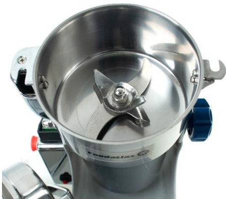
Рис2. Режущее устройство (нож 3х ярусный)