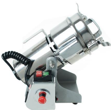
Рис3 Наклоняющийся корпус, с зажимным устройством (для удобной выгрузки, а также для измельченного продукта)